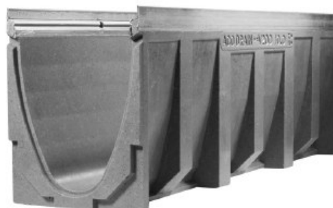
Canal V150 em Betão Polímero com bastidor integrado