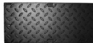
Grelha cega de fundição

Grelha de cobertura Brickslot em aço galvanizado/inoxidável com 10 mm de largura da ranhura para canal e sumidouro V150