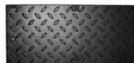
Grelha cega de fundição

Grelha de cobertura Brickslot em aço galvanizado/inoxidável com 10 mm de largura da ranhura para canal e sumidouro V200